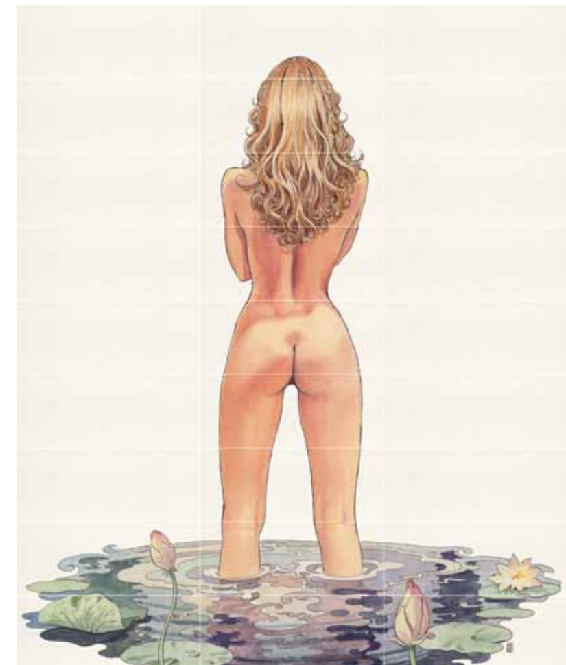
Manara Miele P 13 / BG 18 150x180 59"x71" ■ 351 • Pannello composto da 13 pezzi • 13 Pieces composition • Ein Dekor-Satz besteht aus 13 Teilen • Panneau composé de 13 pièces